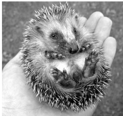
Mittlerweile trinkt er bereits aus einer flachen Schale, schmiegt sich aber noch gerne in die schützende Hand.