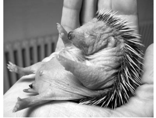
Damit er Wasser lösen kann, muss sein Geschlechtsteil massiert werden. Zuerst zeigt sich aber ein kleiner Kotkegel.