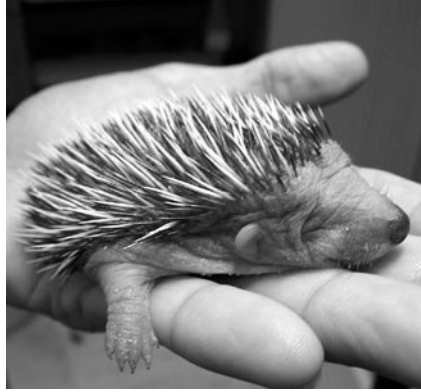
Nach dem ersten Schoppen schläft er erschöpft ein und geniesst die Wärme der Hand. Alle drei Stunden erhält er einen Schoppen.