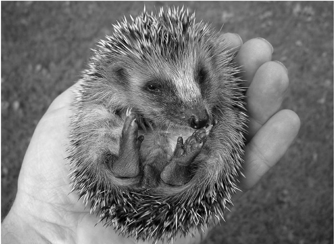
Dieses Foto ist als farbige Ansichtskarte erhältlich unter www.izz.ch