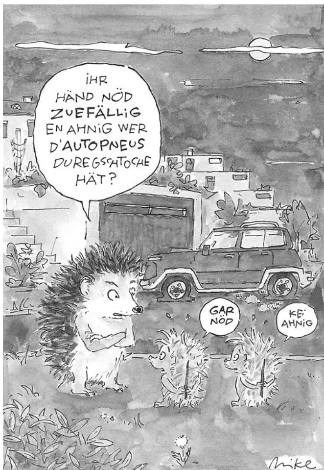
Neue Illustration von Mike van Audenhove. Als farbige Ansichtskarte oder E-Mail-Postkarte unter www.izz.ch erhältlich.

Zauneidechsen (Rote Liste 3, gefährdet) kommen auf Stadtgebiet selten vor!