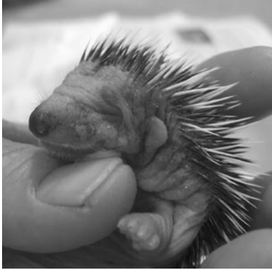
Mäcki wiegt am Fundtag 68g und ist so gross wie der Daumen einer erwachsenen Person.