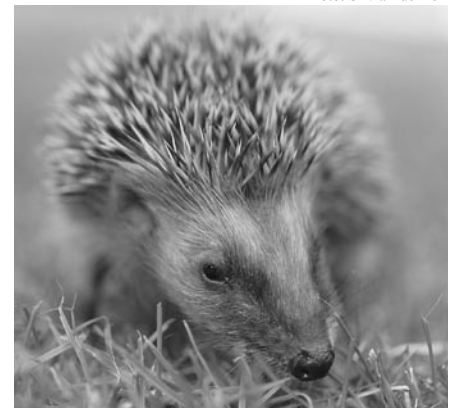
Am 20. Tag frisst er Katzenfutter und darf zum ersten Mal die Wiese erkunden.