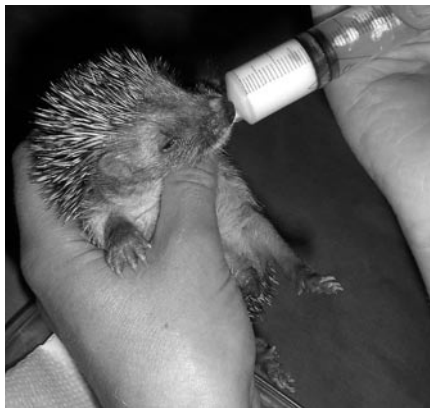
Am 12. Tag hat sich das Schöpfeln schon gut eingespielt. Begierig saugt er die Welpenersatzmilch weg.