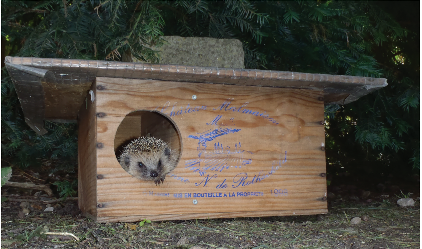
Anstatt eines edlen Tropfens ein stacheliger Gast: Eine wiederverwertete Weinkiste ergibt ein ideales Sommerschlafhaus.