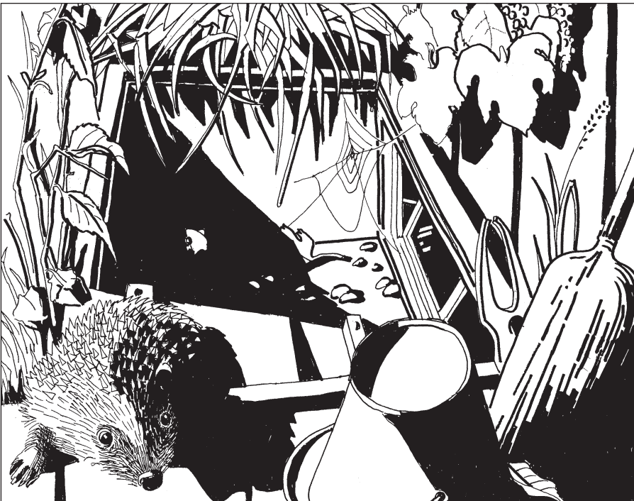
Illustration: Verena Meier