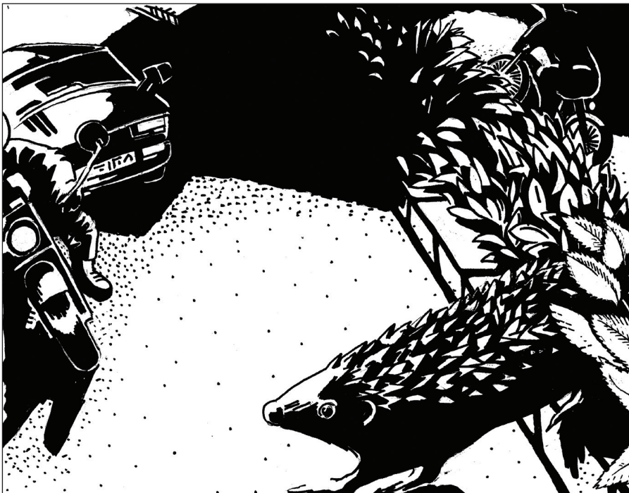
Illustration: Verena Meier