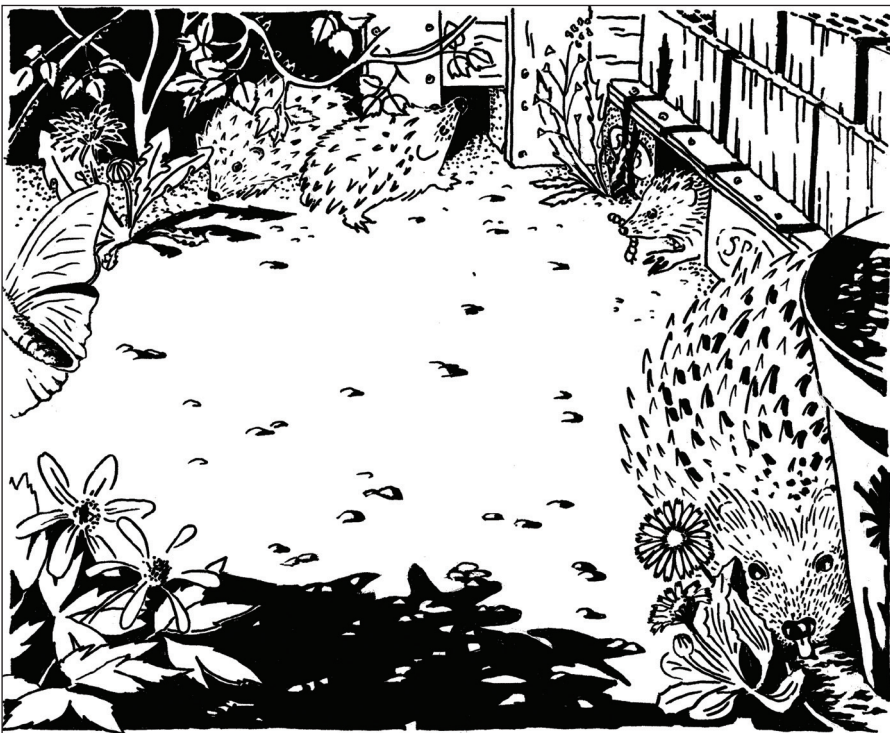
Illustration: Verena Meier