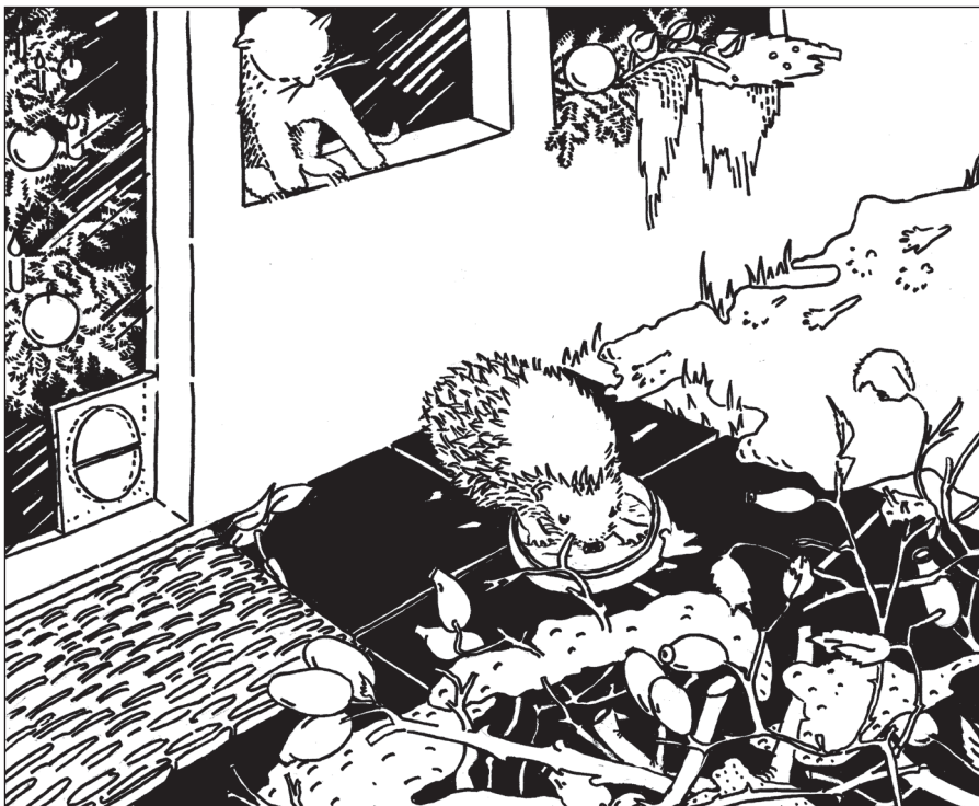
Illustration: Verena Meier