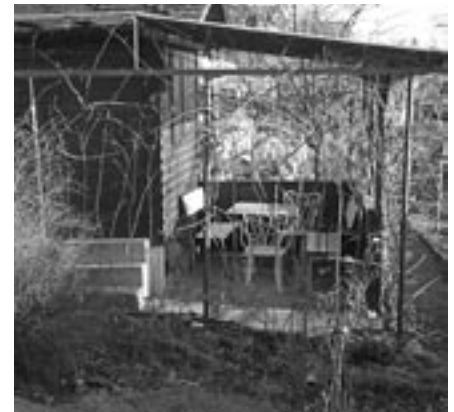
Eine idyllische Reblaube existiert bereits

Liegt Ihnen das Ziel des Schaugartens - wieder mehr Natur in unsere Stadt zu bringen - am Herzen und möchten Sie unser Projekt unterstützen, freuen wir uns über Ihre Spenden, die übrigens steuerlich absetzbar sind. (Ein Einzahlungsschein ist beigelegt. Vermerk: Schaugarten)