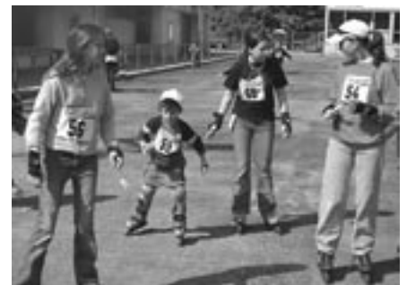
Gemeinsam geht es besser