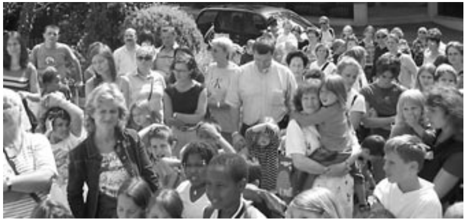
Anlässlich der Veranstaltungsreihe NAHREISEN wollten an einem Mittwoch Nachmittag 150 Personen einen Blick auf einen Igel im Igelzentrum erhaschen.

Nach wie vor ist unser wichtigstes Anliegen die Umweltbildung. Mit unseren Ferienprogrammen in den Sommer- und Herbstferien waren wir in diesem Jahr u.a. in Zürich, Winterthur, Wädenswil, Neftenbach, Zollikerberg, und Dietikon zu Gast und konnten den SchülerInnen an abwechslungsreich gestalteten Tagen viel Spannendes über Igel und deren Lebensraum vermitteln.