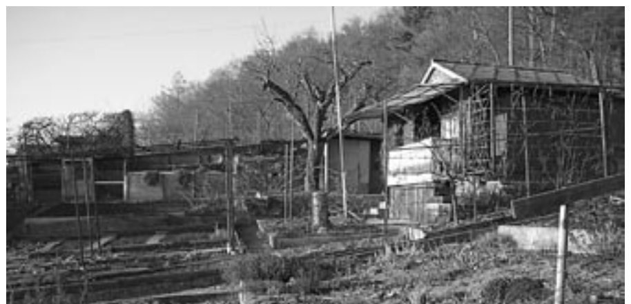
Blick in den Familiengarten

PS: Selbstverständlich erscheint Ihr Name auf der Sponsorentafel des Igel-Schaugartens sowie auf unserer Website www.izz.ch !