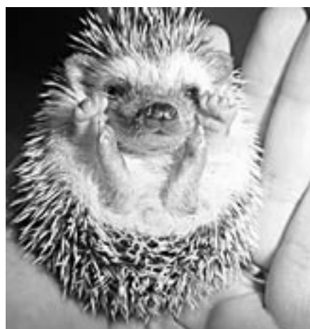
Igelbaby übt das Einkugeln... Fortsetzung Seite 12