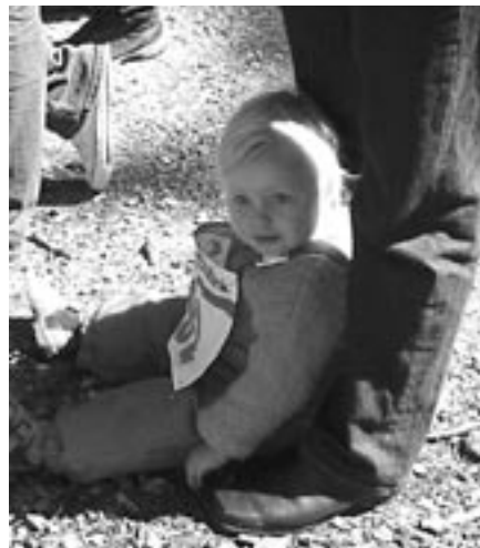
Keiner zu klein, dabei zu sein