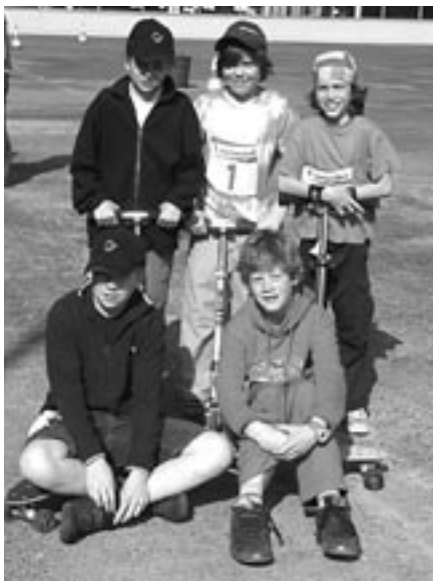
Kick- und Skateboarden auf der abgetauten Kunsteisbahn