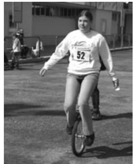
Einradfahren ist erlaubt - Zweiradfahren leider nicht