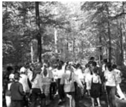
Rennen im Wald