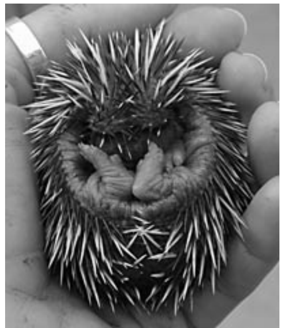
Igelbaby übt das Einkugeln immer noch...

Zahlung der jährlichen Mitgliederbeiträge: Diejenigen Mitglieder, die den Mitgliedsbeitrag für 2005 noch nicht bezahlt haben, möchten wir bitten, dies möglichst bald zu tun, damit wir unsere Arbeit auch dieses Jahr in der gewohnten Qualität fortführen können. Danke!