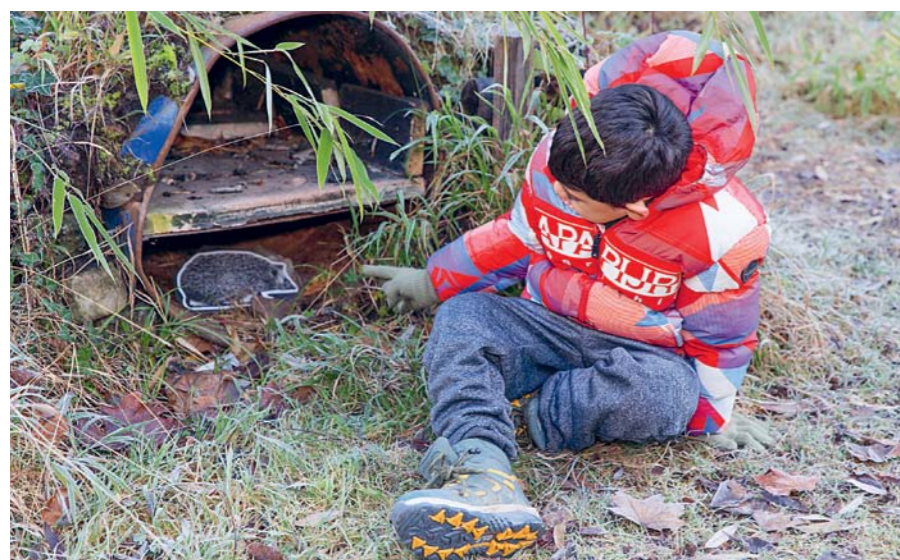
Als Naturdetektive suchen die Kinder im Garten versteckte laminierte Igelphotos. Sie lernen so den Lebensraum des Insektenfressers und dessen Bedürfnisse kennen.

die Grösse des Igeljungen in Relation zu den Körperproportionen der Kinder gesetzt: Die Kinder strecken beide Daumen vor sich in die Luft, und Saskia erklärt: «So gross und breit wie eure beiden Daumen nebeneinander ist ein neugeborener Igel.» Ein allgemeines «Jöö!» ist die Antwort.