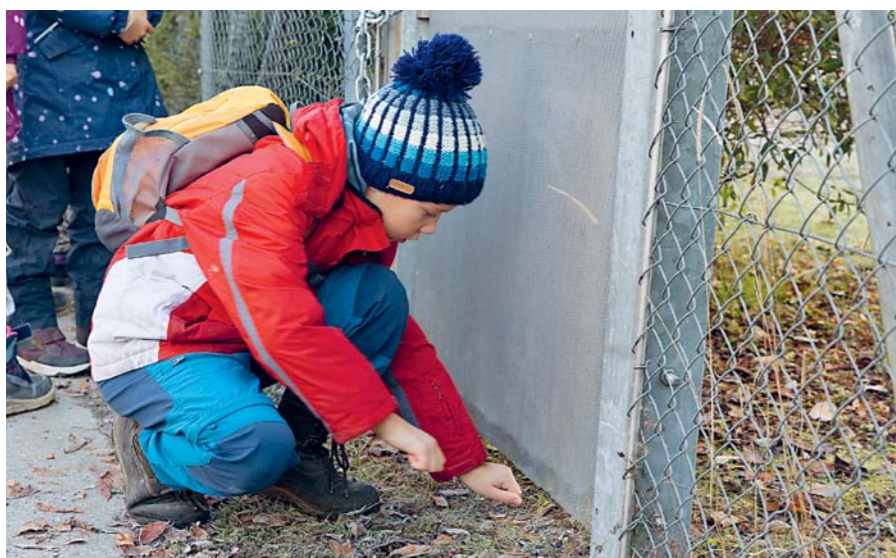
So hoch wie eine Faust muss der Durchschlupf unter einem Zaun sein, damit ein Igel hindurchpasst. Kinder messen mit beiden flachen Fäusten übereinander.