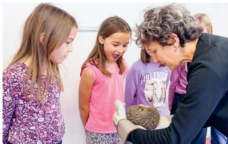
Der Höhepunkt des Igelvormorgens: Die direkte Begegnung mit dem Stacheltier begeistert die Kinder und bleibt eine unvergessliche Erinnerung.