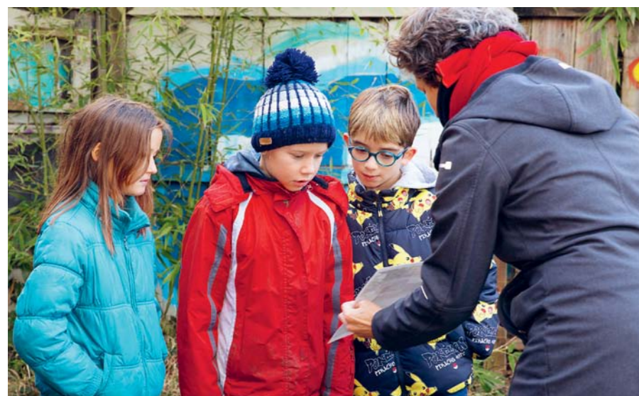
Mittels Fotos tragen die Kinder zusammen, was auf dem Speiseplan des Igels steht – und was nicht.