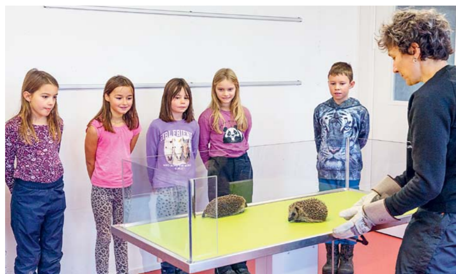
Geduldig und fasziniert beobachten die Kinder die beiden Jungigel. Dabei stehen sie mucksmäuschenstill, um die Tiere nicht zu erschrecken.