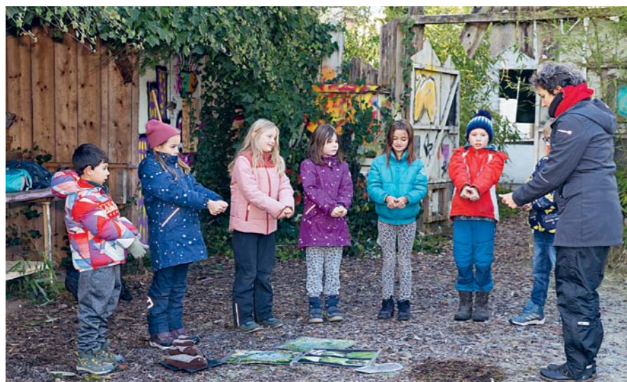
Mit dem Daumentrick lernen die Kinder: So gross und breit wie die beiden Daumen nebeneinander ist ein neugeborener Igel.