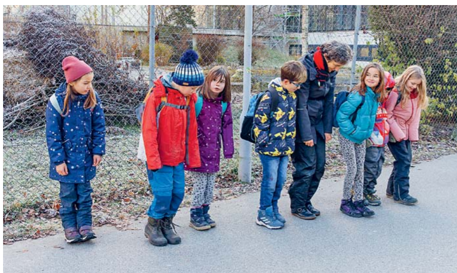
Um die Igel-Todesursache Nummer eins – den Autoverkehr – erlebbar zu machen, überquert die Klasse in winzigen Igel-Trippelschritchen die unbefahrene Quartierstrasse.